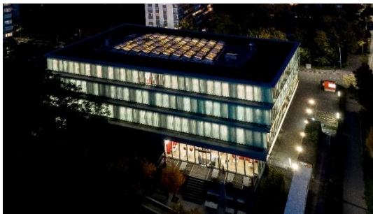
Würth-Gebäude an der Aspermontstrasse 1 in Chur