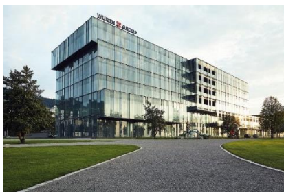
Hauptsitz von CH-Würth Logistics im Würth Haus Rorschach am Bodensee

Im Jahr 2002 wurde Würth Logistics AG aus der Versandabteilung von Würth International AG in Chur (GR) gegründet. Im Jahr 2013 verlegte Würth Logistics AG seinen Hauptsitz ins Würth Haus Rorschach (SG) und gründete weitere Gesellschaften in Deutschland, in den USA und in der Asia-Pacific-Region. Heute arbeiten insgesamt 130 Mitarbeitende bei Würth Logistics, 70 davon in der Schweiz. Die Würth Logistics AG plant, organisiert und steuert mit ihrem Dienstleisternetzwerk die Transportprozesse für die Würth-Gruppe und für externe Kunden und schafft mit cleveren Transportkonzepten Mengen- und Synergieeffekte. Mit Know-how aus der Praxis berät die Würth Logistics AG seine Kunden rund um Zoll und Exportkontrolle.